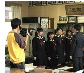
拉致問題対策本部郷路参事官より表彰された受賞者の皆さん

本校での賞状伝達の様子をケーブルテレビあなんで放送します。ご覧ください。 2/23・3/2(11CH) ナゲッパ 7:30~ 12:30~ 15:30~ 20:30~ 23:30~ 2/26・3/5(12CH) ナゲッパ 7:00~ 16:00~ 30分番組の中のニュースコーナーで3分程度放送される予定です。