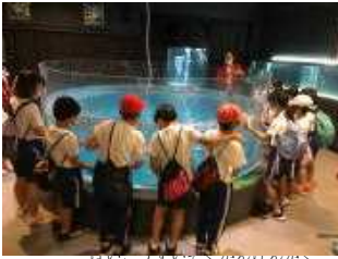
むろと 魔校水族館見学

6月21日（火）～22日（水）、4・5年生が室戸青少年自然の家へ宿泊学習に行きました。天候により、1日目の海の活動はできませんでしたが、好天に変わっていき、充実した5つの活動が全員元気にできました。