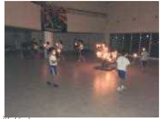
活動③キャンドルファイヤー