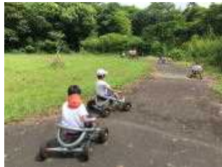
活動④おもしろ自転車体験