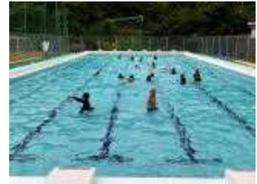
体育「水遊び」(1・2年生)

13日(月)、平年より遅い梅雨入りが発表されましたが、時折照りつける日差しや気温上昇など、熱中症に気を付けて過ごしていきたいものです。校内では予防として、休み時間をはじめ晴天時の外活動では帽子を必ず着用することや、「熱中症アラート」が発表された時、または熱中症指数計での測定で暑さ指数31を超えた時には、外遊びを控えることなどを加えて指導します。先週20日(月)から水泳学習が始まりました。あと3週間ほどで夏休みとなります。これからまだまだ暑くなりますが、元気に1学期を締めくくってほしいと思います。