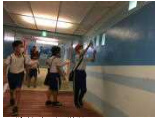
活動①室内フォトビンゴ