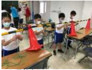
活動②ロープワーク