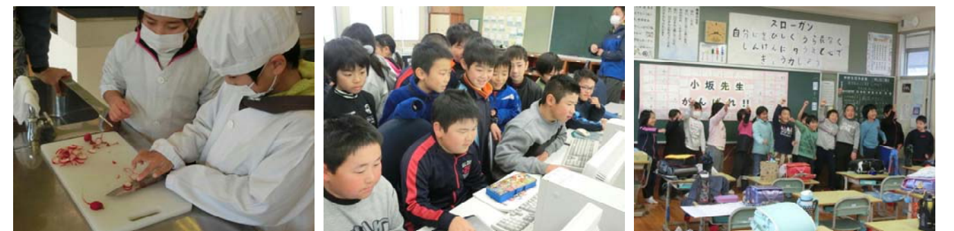
収穫した二十日大根の調理

さて、ここからが3学期です。35日間しかありませんでしたが、いろいろな体験をしました。