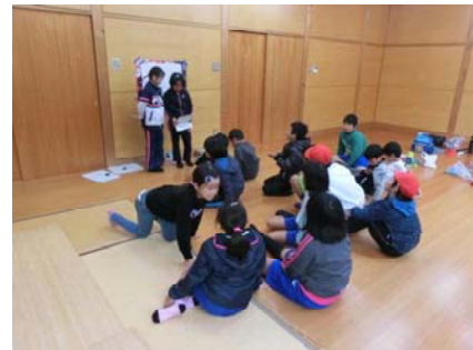
お弁当の後はレクレーション♡