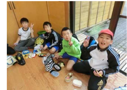
海南文化村でお弁当