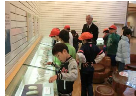
博物館…昔の物に興味津々

下の3枚は12月3日の三世代交流会の様子です。ストライクナインで、子どもたちが考えたルールが面白かったです。