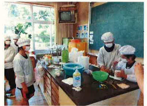
〈番茶クッキーの試作〉