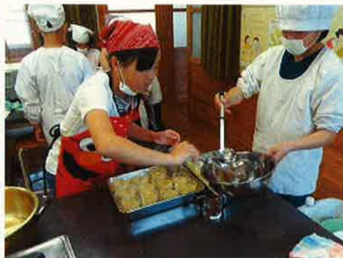
〈ゆこうゼリーの試作〉