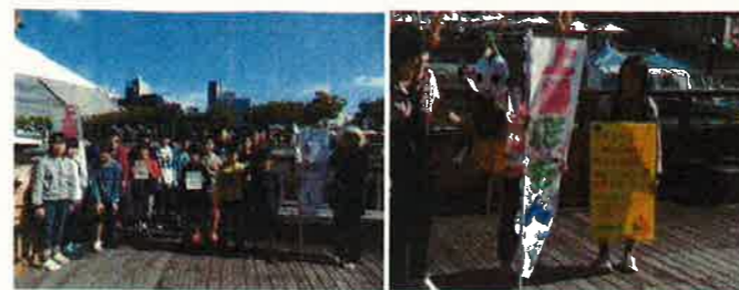
<とくしまマルシェで> <アピールしよう>

「100セットを販売するために、みんなで分担しよう。」 「ゆこうや晩茶のよさをアピールしよう。」 「買ってもらって、ゆこうや晩茶の味を知ってもらおう。」 「上勝を元気にしたいな。」