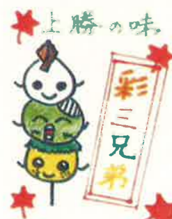
<キャラクター彩三兄弟>