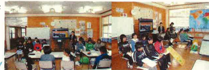
<活動の様子を伝える> <5年生からの質問を受ける>

「伝える工夫をしよう。」 「5年生の質問に答えよう。」 「分担してプレゼンしよう。」 「ぼくたちが取り組んだ活動の様子が伝わるように写真を選ぼう。」