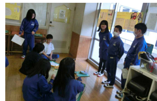
報告します 私たちの生活