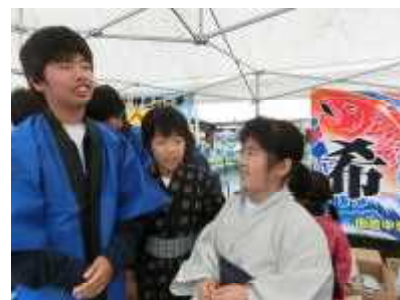
いらっしやいませ いらっしやいませ 伊座利のヒジキはどうですか。