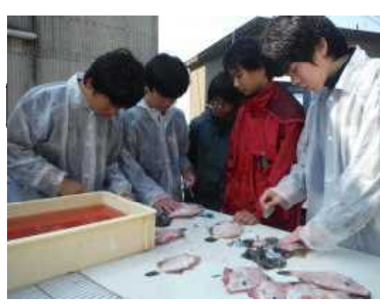
「種類が多くて、仕分けって難しいなあ。」 実際、小魚たちは食卓の人気商品です。

春のヒジキ刈り遠足から6月11日の日曜市に向けてゴミ取り作業や袋詰め、販売練習など自分の役割をはたしながら一生懸命に活動してきました。日曜市の会場では、開店早々からお客様が途絶えることなく、用意したヒジキ(小340袋、)が4時間30分ほどで完売しました。また、流木キーホルダー(10個)も売れました。今年も「伊座利のアラメの佃煮」を販売。試食コーナーも設けて、好評のうちに177個売れました。ヒジキといっしょに採ってきたふのりも乾燥させ、細かなゴミを取り除いて 伊座利漁協に買い上げてもらいました。