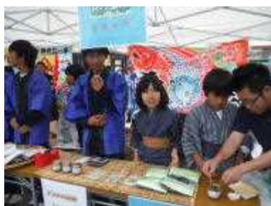
さあ！伊座利の商品を売るよ 試食の準備もバッチリ！