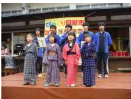
小学生も中学生も本部前の会場で伊座利のPRと合唱・合奏 何ともかわいいものですね。

本当に伊座利っ子にとって貴重な体験をすることができました。豊かな自然の恵みと伊座利の皆さんの応援と子どもたちのがんばりの結果、ひとつのことをやり遂げたという気持ちを実感することができました。地域の方々や保護者のみなさま、温かいご支援をいただきありがとうございました。おかげさまで、ヒジキ、ふのり、流木キーホルダー、佃煮の売り上げ収益は合わせて221,008円になりました。児童・生徒の活動のために使わせてもらいます。