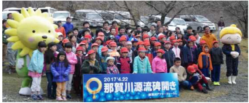
1年生は元気に山探検