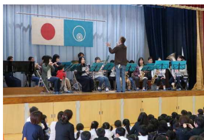
親子ふれあいコンサート