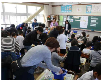
アサガオの植え (1年)

4月27日(土)に授業参観を行いました。1年生は保護者と一緒にアサガオの植えの勉強をしました。2年生から6年生も学習に張り切って取り組んでいました。