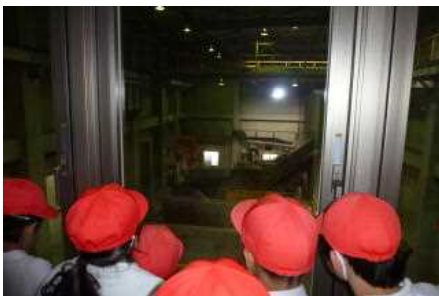
鳴門市クリーンセンター等（4年）