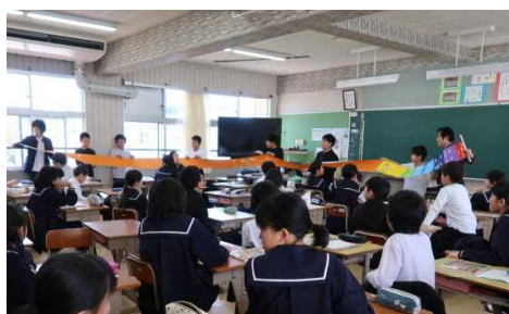
弥生時代のくらし (6年)