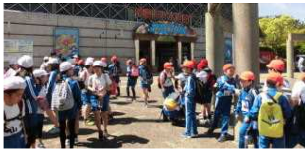
須磨海浜水族園（5年）