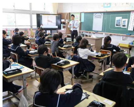
はじめての毛筆 (3年)