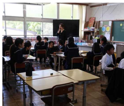
リフレーミング (5の1)