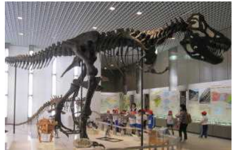
県立防災センター・文化の森総合公園（1年・2年・3年）