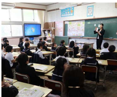
めざせ 名たんてい (2年)