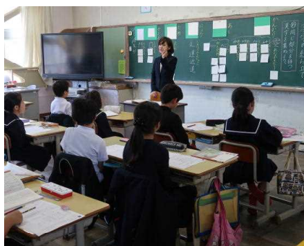
漢字の組み立て (4年)