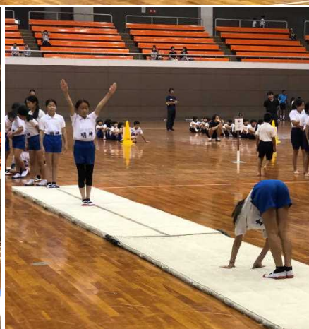
マット運動「 伸しつ後転 」