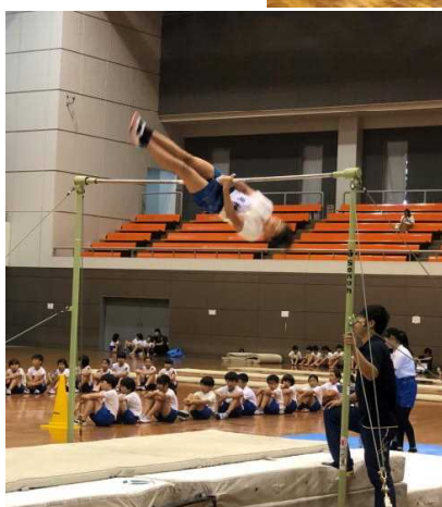
鉄棒運動「 プロペラ 」