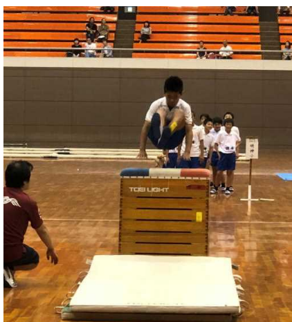
跳び箱運動「 仰向け跳び 」