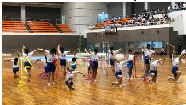
徒手体そう「パプリカ」

6月20日(木)に、校内体操発表会・市体操発表会がありました。出場した児童は、始業前や業間・放課後、一生懸命に磨いてきた技を全校児童の前で発表し、午後からはアミノバリューホールで市内全小学校の代表児童の前で素晴らしい演技を披露することができました。応援・児童のお迎えに来てくださった保護者の皆様、お世話になりました。