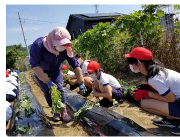
地域の方とともに さつまいもの苗植え(5/31)