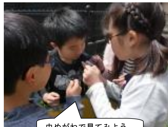
虫めがねで見てみよう。