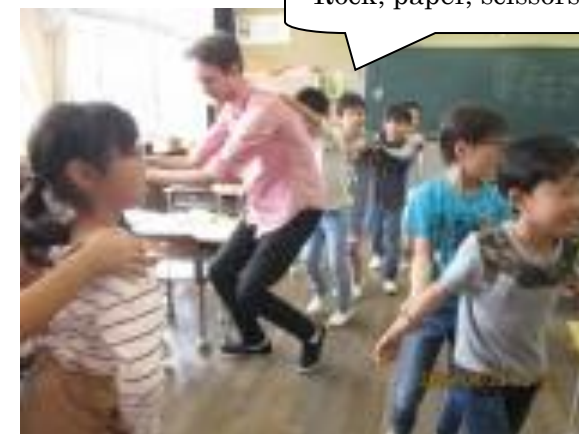
Rock, paper, scissors !