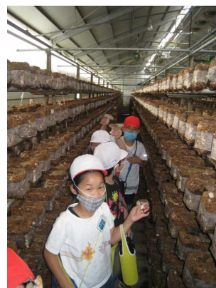
しいたけ農家の見学

○ 7月20日から3日間の予定で個人懇談を実施いたします。詳しいことは、後日お知らせいたします。短い時間ですが、学習や学校生活の様子について話し合い、今後に生かしていきたいと考えています。ご理解とご協力をよろしくお願いいたします。