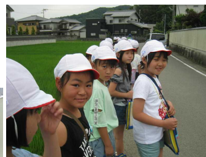
地域の様子を見ながら たんけん