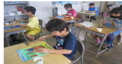
図工「コリントゲーム」 好きな絵をかいた木板に、金づちで釘を打ちました。