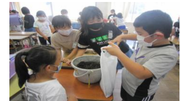
算数「重さ」 1キログラムの重さの土をはかりとりビニル袋につめて、重さを感じ取る活動をしました。