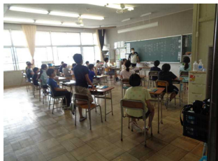
【教室や給食室前廊下が密にならないよう】