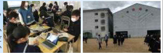
参観授業での防災グッズ作成 地震を想定しての1次避難