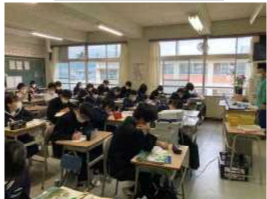
昭和南海地震知ってる？