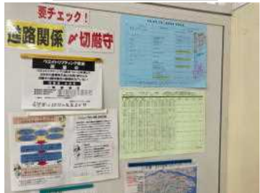
教えあうのは伝統です